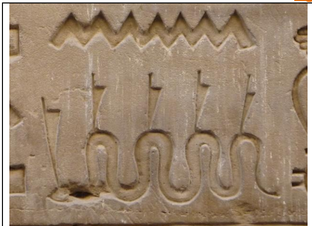
Vyobrazení Apopa, Egypt

Přes obrovské množství podivných bytostí egyptské náboženství nezná klasického draka.