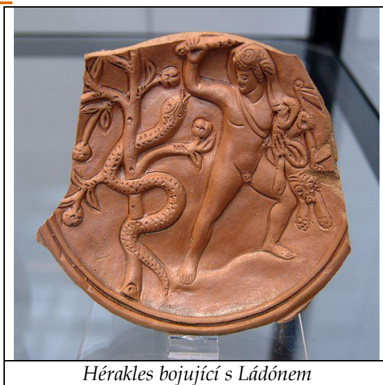
Hérakles bojující s Ládónem

Dalším drakem je Pýthón , kterého stvořila bohyně Gaia, aby ochraňoval Delfskou věštírnu. Dlouhou dobu šířil hrůzu a nikoho nenapadlo, že by ho mohl přemoci. Pýthón však dobře věděl, že mu hrozí nebezpečí, neboť mu bylo předpovězeno, že jej zabije některý z bohů. Nakonec ho zabil bůh světla a slunce Apollón.