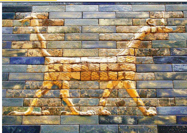
Freska draka na lštařině bráně

Tehdejší podoba draka je dobře známa z archeologických vykopávek: drak má hadí hlavu s velkýma očima, rozeklaný, hadí jazyk a roh na hlavě. Krk má velmi dlouhý, jeho tělo je pokryto šupinami a má čtyři nohy. Zadní tlapy jsou opatřeny ptačími pařáty. Mezi odborníky panuje neúplná jednota o jeho funkci, schopnostech či vlastnostech.